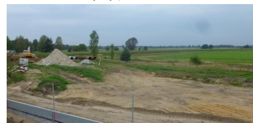
Knotenpunkt S 285 / K 9219 während der Entsiegelungsarbeiten (Sept. 2014), geplante Maßnahmenfläche A 3