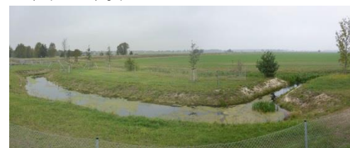
Gewässer A 3 nach der Herstellung (Okt. 2016)