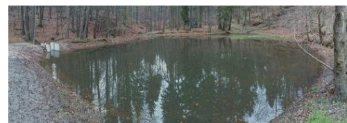
Forellenteich nach Entschlammung