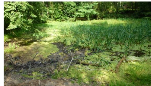
Forellenteich vor Entschlammung

Bearbeitungszeitraum LPh 5 und 6: Januar 2013 - März 2013 LPh 8: September 2013 - November 2014