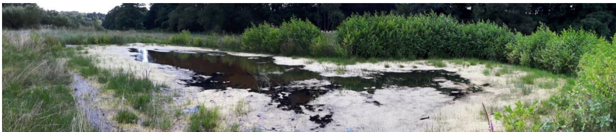
Kleingewässer Klemnitzau nach Realisierung (Stand 2016)