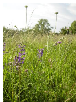
Begrünung und Wiederbesiedlung der Deiche durch spezielle Ansaat- und Begrünungsverfahren (Heudrusch®-Verfahren)

Auftraggeber Landesumweltamt Brandenburg