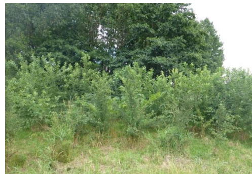
AT 5.8 Erweiterung eines Feldgehölzes oberhalb der Eulaaue im 3. Standjahr (Juli 2016)