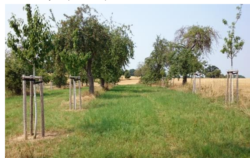
E 2.7 Verjüngung einer Streuobstwiese zwischen Niedergräfenhain und Hermsdorf im 2. Standjahr (August 2015)