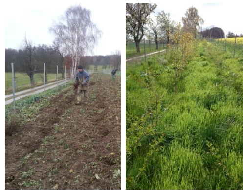
Maßnahme A 4.11 „wegbegleitende Feldhecke zwischen Hermsdorf und Prießnitzer Holz“: bei der Pflanzung im Dezember 2013 sowie im 3. Standjahr April 2016