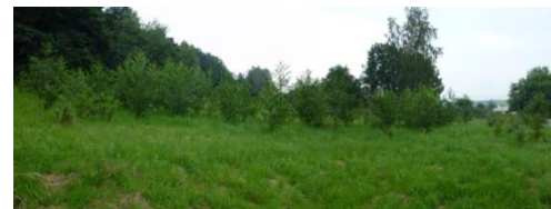
E1.5 „Entwicklung standortgerechter Waldbestände“ (2016)