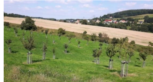
A6.4 „Erweiterung einer Streuobstwiese südl. von Wünschendorf“ im 3. Standjahr 2016