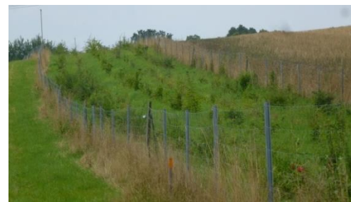
A7 „Feldhecke an einer Nutzungsgrenze“ im 3. Standjahr 2016