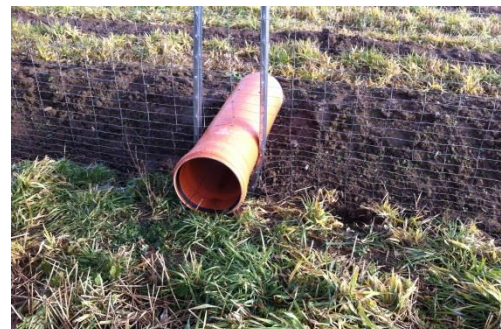
bei der Zaunherstellung: Einbau von Fuchsröhren zur indirekten Mäusebekämpfung