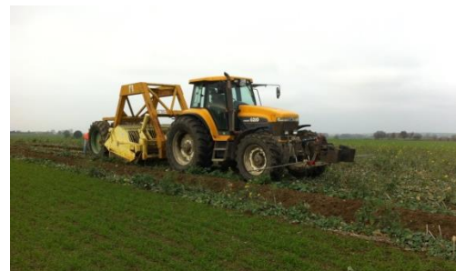
maschinelle Vorbereitung der Peinplant-Reihen