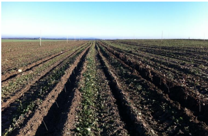
fertiggestellte Teilfläche E3.3 mit forstlichen Junggehölzen

Bearbeitungs- zeitraum 2013-2014 / 2019 (Bauleistung / Pflegezeit)